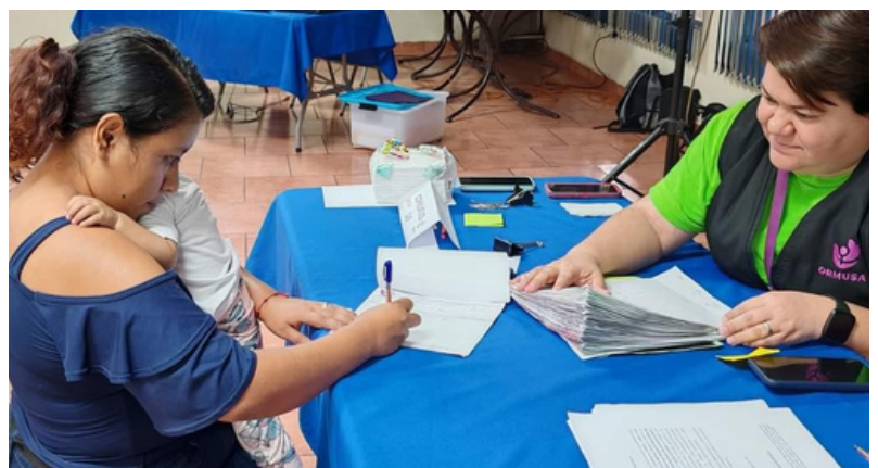
Abogada de ORMUSA en entrega de ayuda humanitaria a ex trabajadora beneficiada.