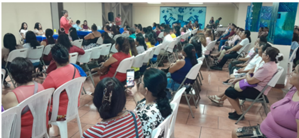
Reunión de ex trabajadoras y trabajadores de maquila APS, donde se les informó cómo se haría la entrega de la ayuda humanitaria recibida por WRC

Entre estas fábricas cerradas está APS de El Salvador, que suspendió operaciones en agosto de 2022, dejando a 850 personas sin trabajo; además de la fábrica Style Avenue, que cerró en mayo de 2023, donde trabajaban unas 244 personas, a quienes no pagó sus prestaciones.