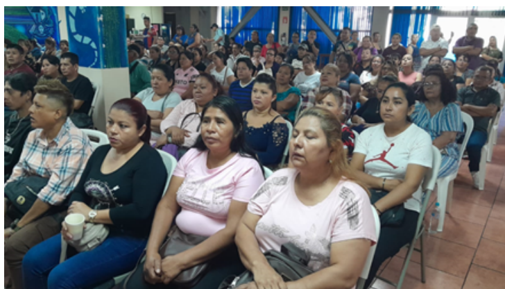
Personas extrabajadoras de maquilas APS y Style Avenue, en reunión informativa sobre entrega de ayuda humanitaria.