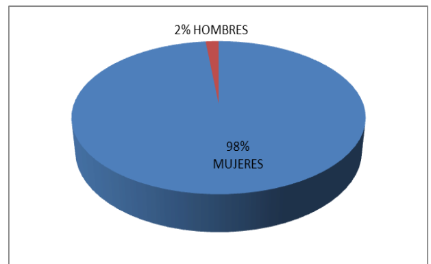
SEXO DE USUARIAS/OS