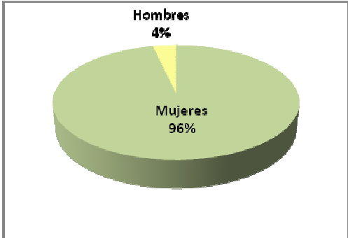
SEXO DE USUARIAS /OS